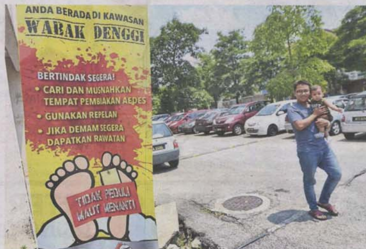
Banners at dengue outbreak areas are a common sight in many parts of the Klang Valley.

Selangor authorities worried as more than half of nationwide cases have occurred in the state