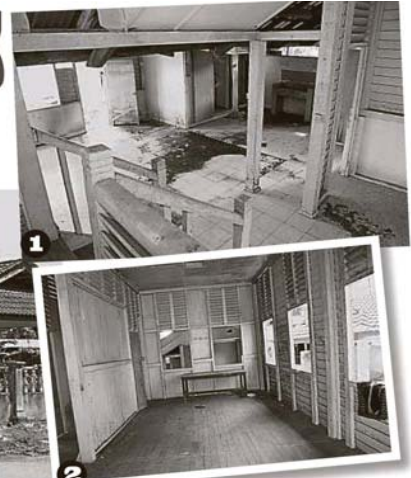
1. 酋長官邸被廢置多年，造成有些空間變成骯髒，有些角落還有蟻蟻糞便和不明的污物。 2. 記者拾級而上，發覺建築物內部結構良好，戶外也有足夠的采光，尤其是木板建築物线条简洁俐落，頗具獨特風味。

“有關地段是屬於土地的局產業，他們需要提交到雪州行政議會，以擬出工程清單 (Bill of Quantities, 簡稱BQ) 和進行審查。”