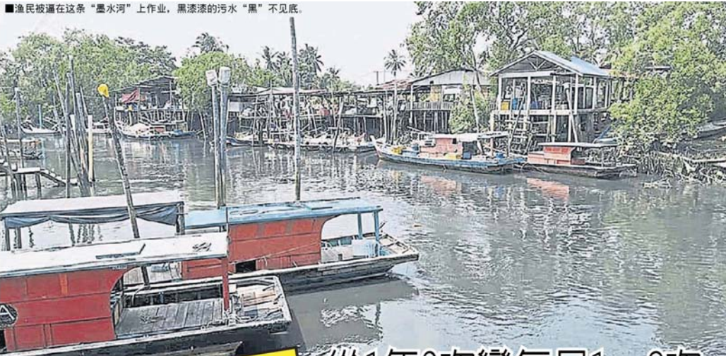
■渔民被逼在这条“墨水河”上作业，黑漆漆的污水“黑”不见底。

Provided for client's internal research purposes only. May not be further copied, distributed, sold or published in any form without the prior consent of the copyright owner.