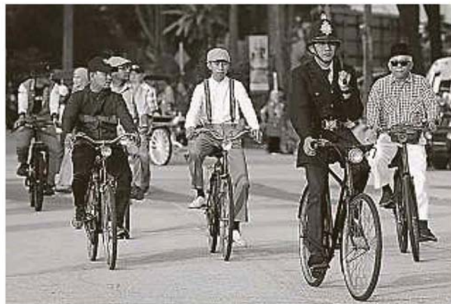
嘉年华会上出现的复古脚车，吸引众人目光。

有大约5000人出席今早这项邀请雪州苏丹后诺拉茜金主持开幕的3W嘉年华会，参与步行1万步、健身操和攀岩等活动。