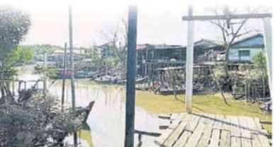
■当该河没有被污染而“染黑”时,河水是青色,而且没有化学臭味。

林耀明指出,他不排除一些工厂取巧避开取締,导致当局无法揪出罪魁祸首。 他说,这些工厂相信都有安装符合规格的排污系统,但是他们时不时就绕过有关系统,暗地直接把废料排入河中,目的是为了节省成本,但当执法当局检查时,他们可以展示排污系统,逃过责任。 他希望执法当局更加严谨调查,别再让这些破坏环境者,逃过法律责任,否则污染问题将会持续没完没了。