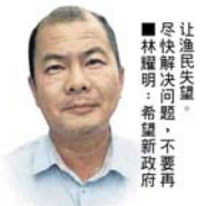
■尽快解决问题，不要让渔民失望。林耀明：希望新政府不要再次让他们失望。

報導 ●高志豪 (巴生4日訊)从1年污染3次,如今演变成1个月1、2次,沙沙兰河口渔民疑问:“污染何时?” 《中国报》大城事于2016年3月11日曾报导沙沙兰(Sasaran)渔民多年来,长期面对“季节性”的河水污染问题,原本清澈可见鱼虾的河水,疑遭工厂废料污染,呈现墨水色,甚至带有强烈化学药剂臭味,让人受不了。