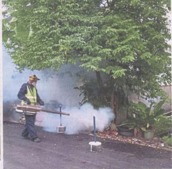
MPS Health Department personnel fogging a neighbourhood.