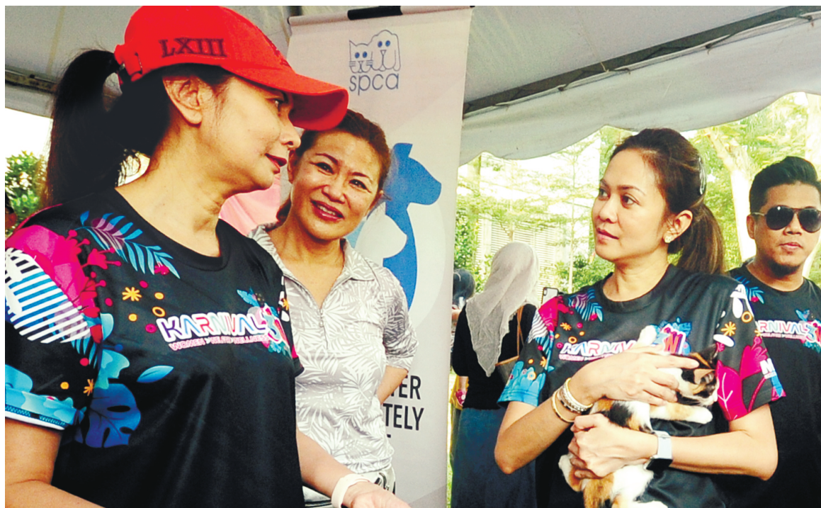
ROYAL VISIT ... Tengku Permaisuri Selangor, Tengku Permaisuri Norashikin being briefed on the activities at an 'Adopt a Cat' and 'Car Free' carnival organised by the Shah Alam City Council in Dataran Kemerdekaan yesterday.