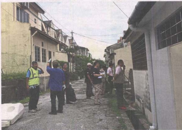
In response to the dengue rise, residents in Subang Jaya had a gotong-royong to clean up their neighbourhood.