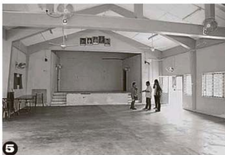
3. 蔡志雄 (左) 與余東發共同巡視被廢置多年的酋長官邸。 4. 傳統馬來高脚樓建築物的設計頗為獨特及具有歷史考究價值，因此不會拆除，而是會視破壞程度進行整修。 5. 雙溪比力村委會會所內有一個偌大的禮堂，這座會所曾由前任雪州行政議員歐陽輝華主持揭幕啟用儀式。