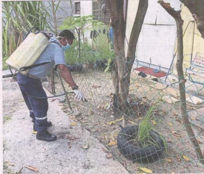
An MPS worker conducting larviciding at a neighbourhood.