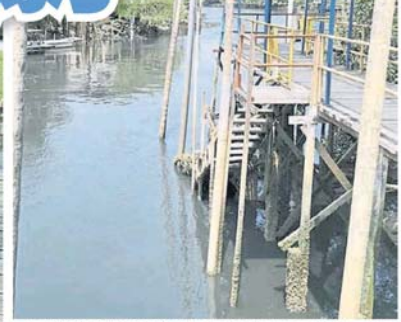
■一些渡头载送游客前往近年最景点“天空之境”,如今该河经常染黑,游客看了也惊心胆战。

■渔民形容河中传出浓浓化学臭味,闻了非常不舒服,有者感到头晕、想作呕等。 一该河一旦变黑,有时还会有一层油出现,河边一些树木枯萎,相信也与污染有关。