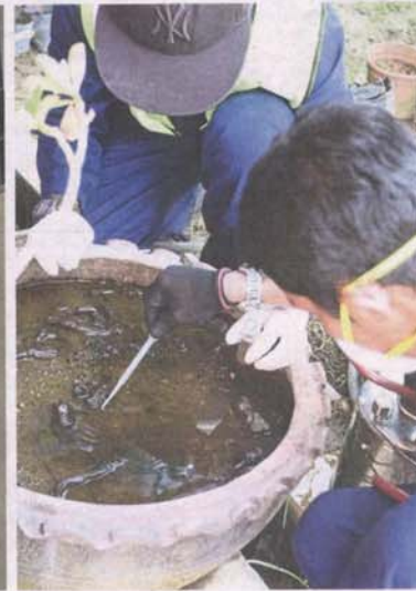
An MPKJ search-and-destroy programme in progress.